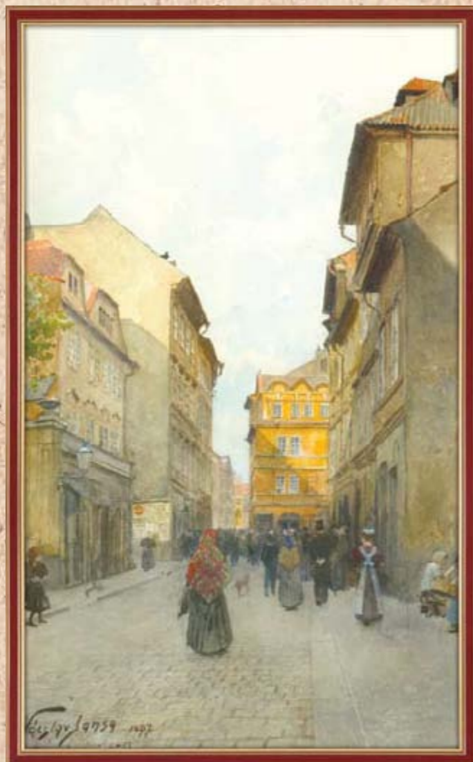
Улица Широка, Йозефов

Наш специальный проект подарит вам несколько мгновений этого тихого чувства, показав Прагу начала 20-ого столетия на акварелях Вацлава Янсы и Прагу новую, к которой мы уже успели привыкнуть. Мы привыкли и не знаем, какие жемчужины она скрывала в себе сто лет назад, как много она потеряла за бурный и непредсказуемый 20-й век. Попробуйте взглянуть на эти фотографии глазами сына Праги, погрузите немного об утерянном и нырните с головой в современность.