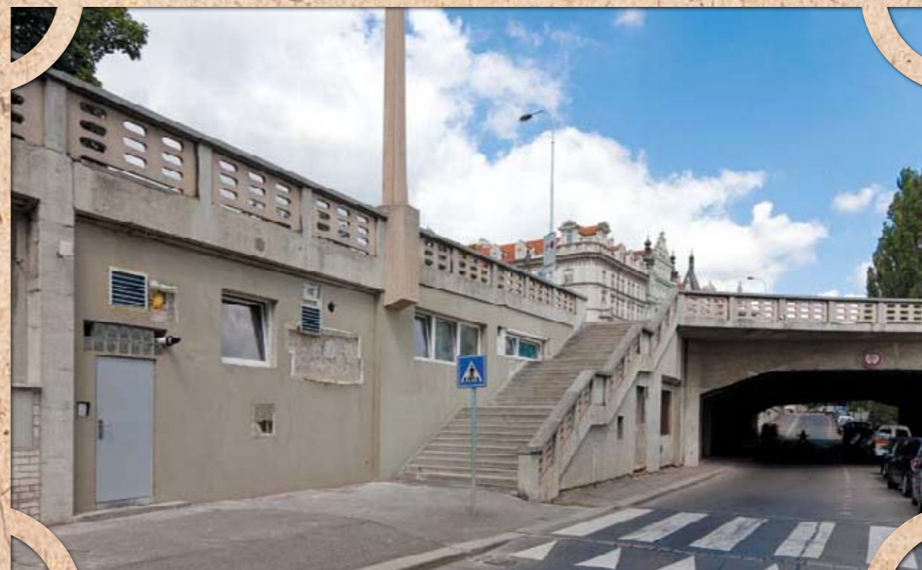
Улица Набережная под Йирасковым мостом, Смихов

На старой акварели мы видим тихую улицу, к которой примыкает стена иезуитского приюта св. Варфоломея. Абсолютно иначе выглядит это место сегодня. Переходной стадией между приютом и просто дорогой был Ботанический сад Карлова университета, который потом был переселён на другую сторону реки. Сейчас здесь увидишь лишь бетонные опоры моста.