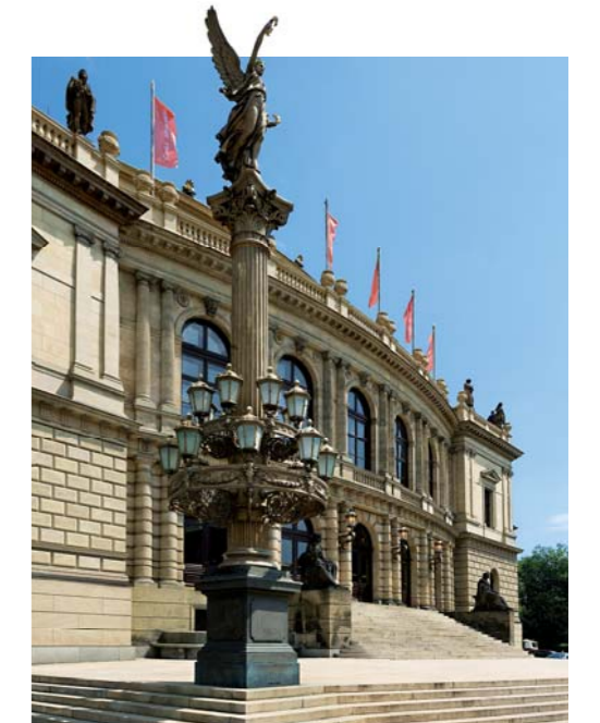
Здание Рудольфинума производит впечатление одновременно торжественное и сдержанное и очаровывает возвышенным решением внутреннего убранства. В декоре интерьера доминирует классический мотив парных колонн, от парадного фойе и до концертного зала имени Дворжака, где главная роль принадлежит органу в виде фронтона античного храма.

Мстислав Ростропович (первая премия 1950 года). Залы Рудольфинума также служат в качестве учебных аудиторий Академии музыкальных искусств и консерватории, расположенной рядом.